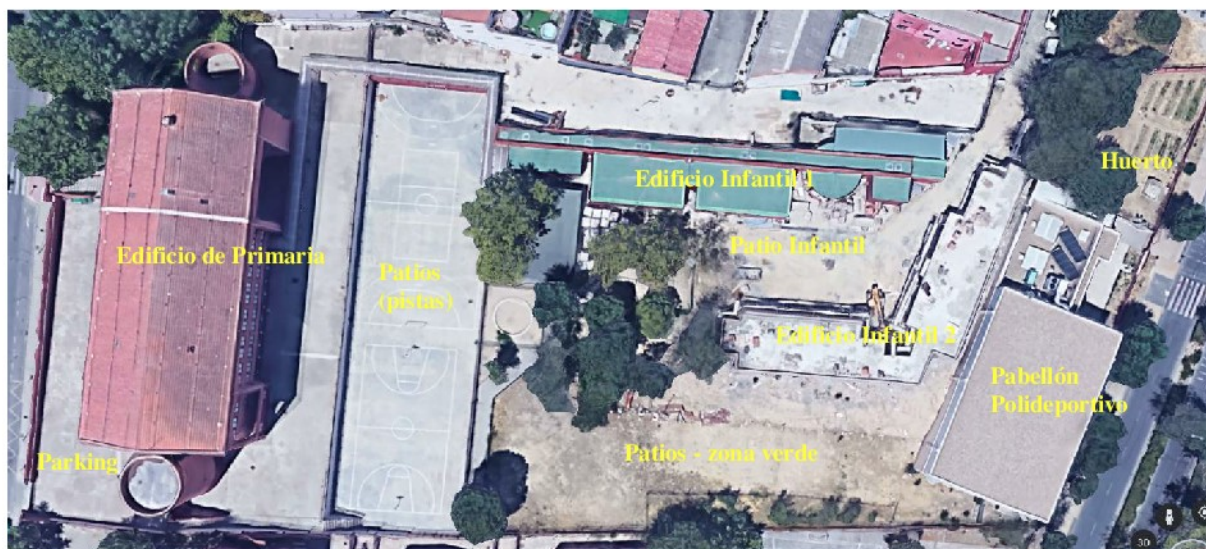
(fecha imagen 26-04-2021)